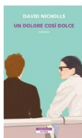
Un dolore così dolce : [romanzo]